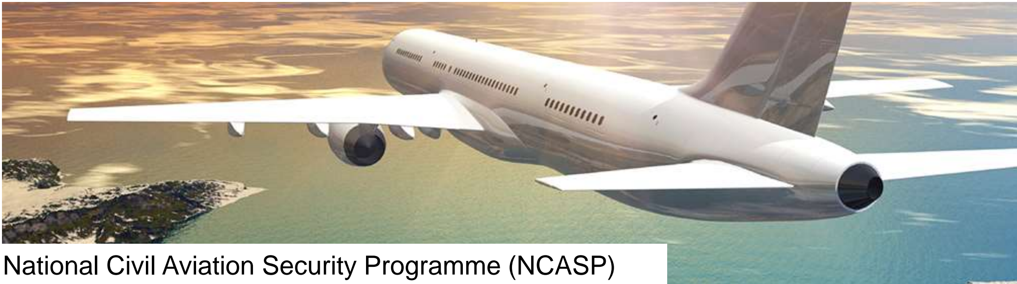
National Civil Aviation Security Programme (NCASP)